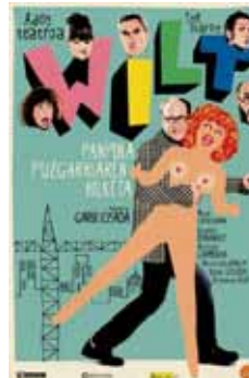
OTSAILAK 3, "Wilt Panpina puzgarriaren hilketa"

AKTOREAK/Actores: Jorge Sanz, Elena Furiase eta Pablo Puyol.