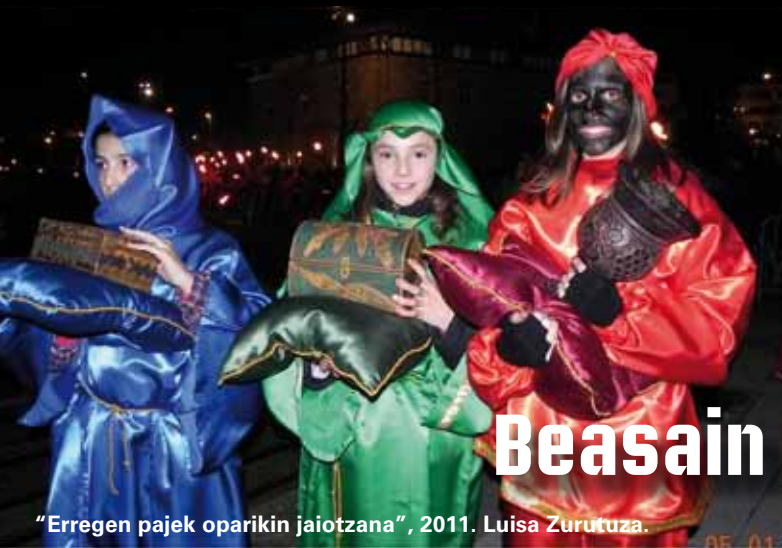
"Erregen pajek oparikin jaiotzana", 2011. Luisa Zurutuza.