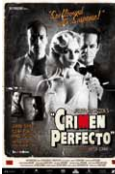
URTARRILAK 13, ostirala "Crimen Perfecto"

Frederick Knott antzerkigile ingelesak idatzitako obra da. BBCn estreinatu zen 1952an eta, ondotik, Londresko eta New York-eko antzokietan eman zuten. Bi urteren buruan, filma egin zuten Knott-en beraren gidoiarekin eta Alfred Hitchcock-en zuzendaritzapean. Margot emaztea hil nahi du Tony Wendice-k, haren diruaz jabetzeko.